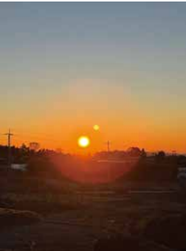
前橋市の初日の出