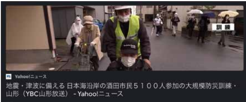
Yahoo!ニュース 地震・津波に備える 日本海沿岸の酒田市民5100人参加の大規模防災訓練・山形 (YBC山形放送) - Yahoo!ニュース

ホームページからの引用ですが、「毎年大晦日から、明るく元旦にかけて、夜を徹して行われることから別名歳夜祭ともいわれ、羽黒修験の四季の峰のひとつ「冬の峰」の満願の祭事です。また古来よりこの祭りの費用を得るため、松の勧進として庄内地方の家々に出向き松例祭の